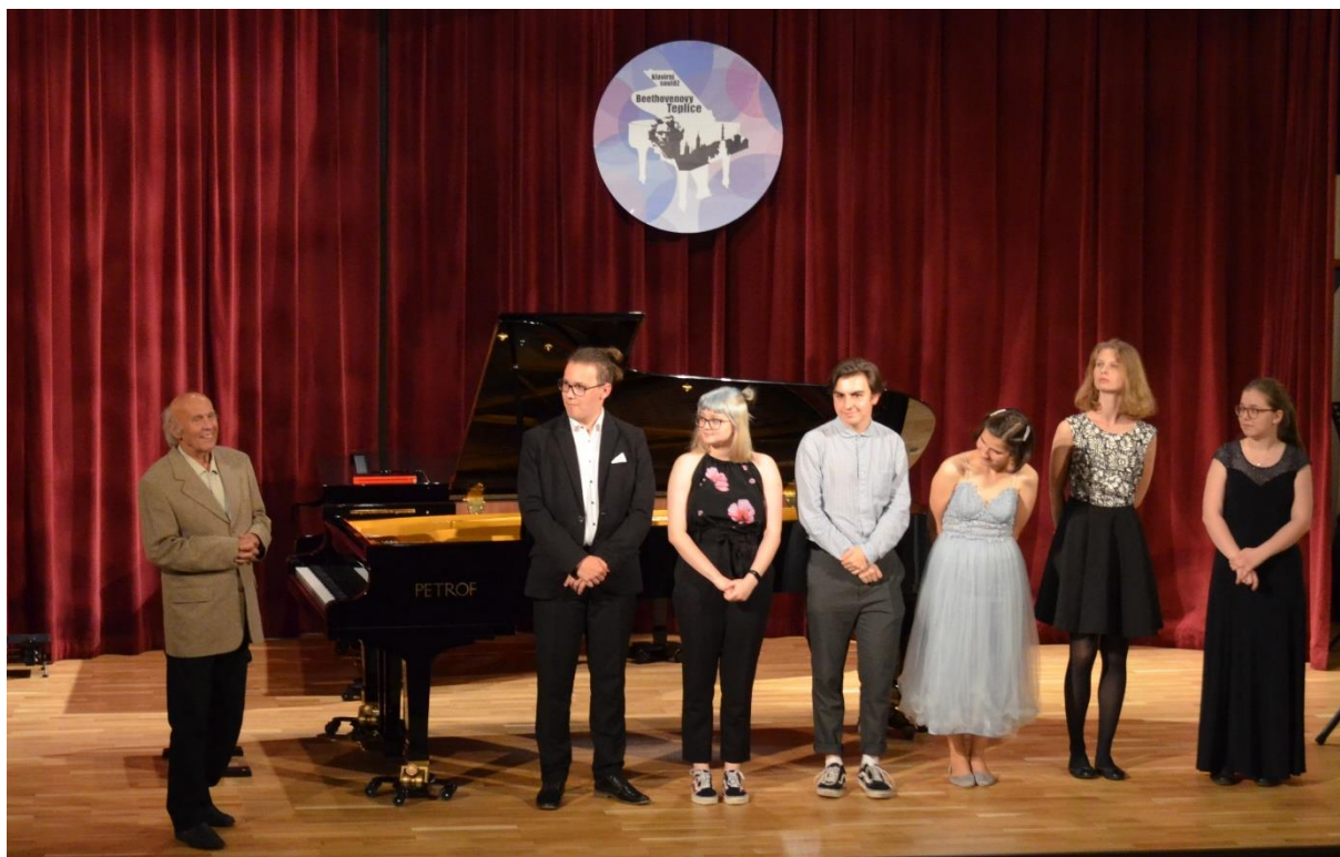
Klavírní soutěž Beethovenovy Teplice 2020 – slavnostní vyhlášení oceněných (včetně žáků teplické konzervatoře, 21. 6. 2020)