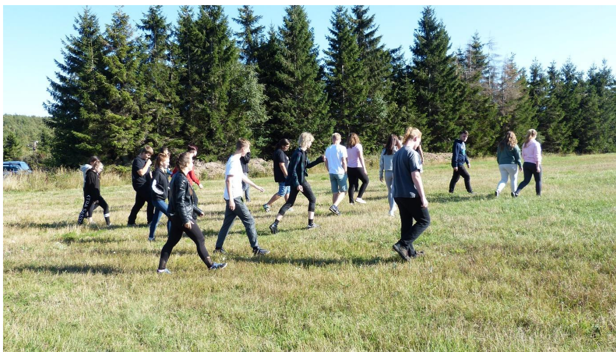
Adaptační kurz 1.A, Mikulov, 5. – 6. 9. 2019