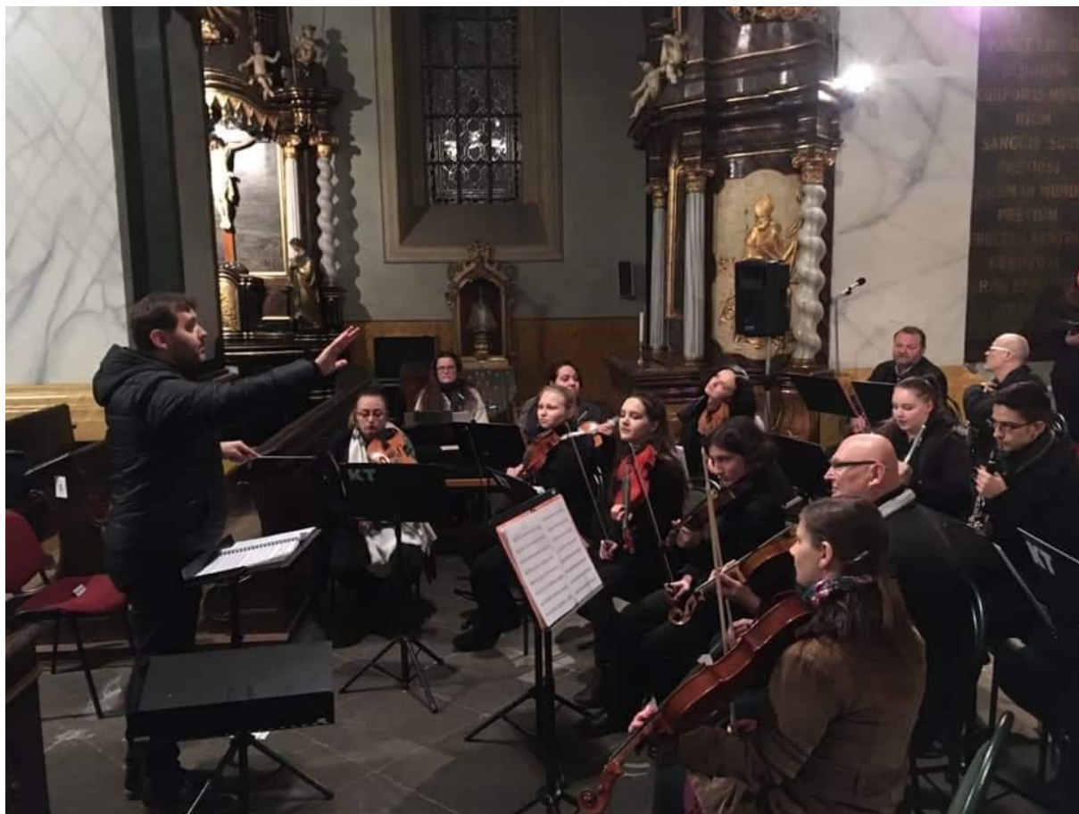
Orchestr Konzervatoře v Teplicích na vánočním koncertě ve Strupčicích