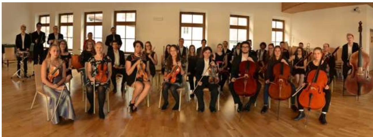
Symfonický orchestr teplické konzervatoře