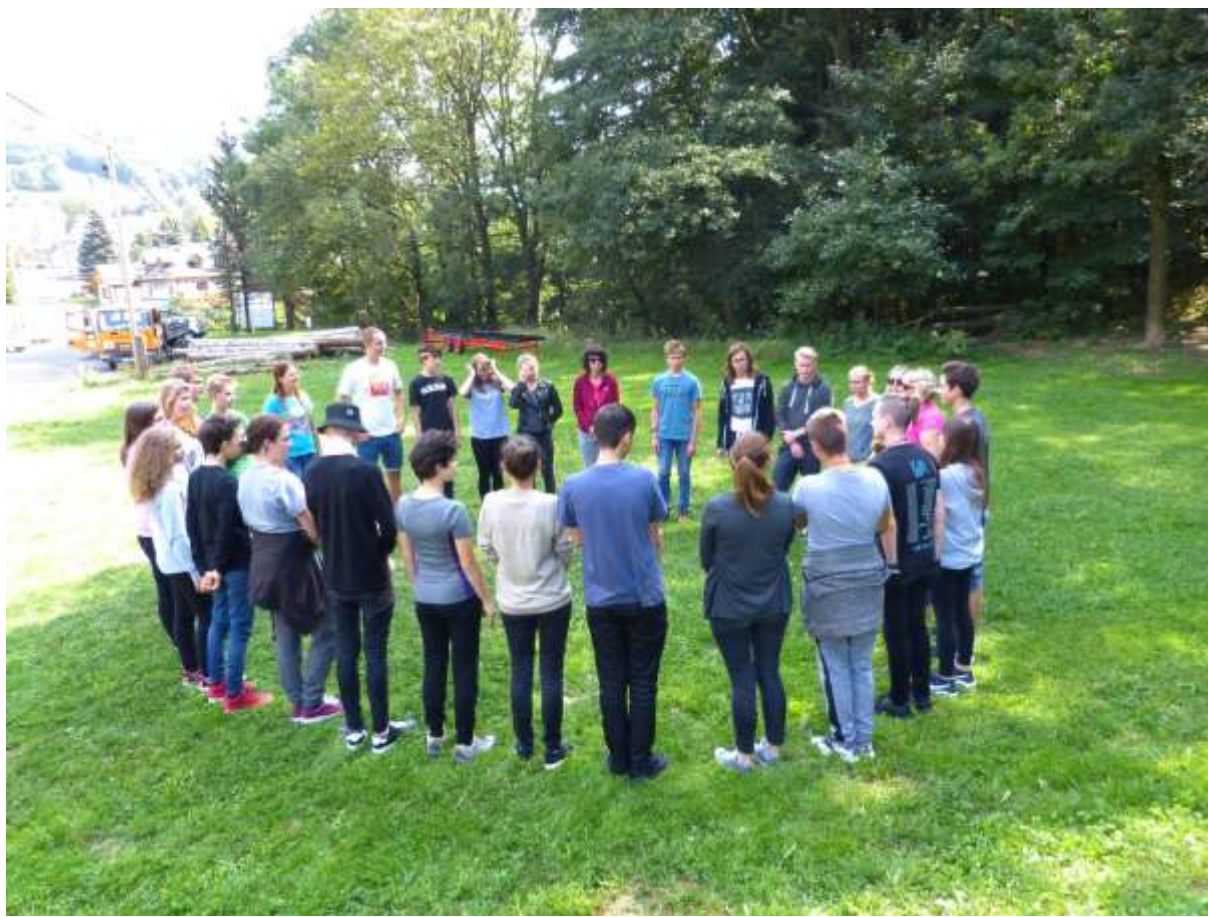
Adaptační kurz 1.A, Mikulov, září 2018