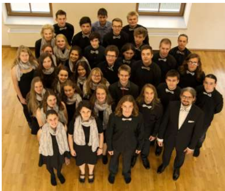
Smíšený pěvecký sbor teplické konzervatoře